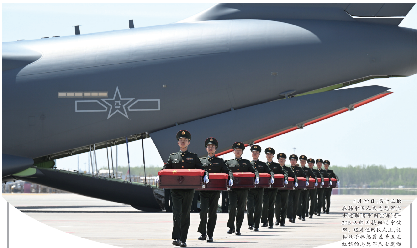
4月22日,第十三批在韩中国人民志愿军烈士遗骸由“运-20B”从韩国接回辽宁沈阳。这是迎回仪式上,礼兵双手捧起覆盖着五星红旗的志愿军烈士遗骸棺槨,缓步走下专机。(新华社发)