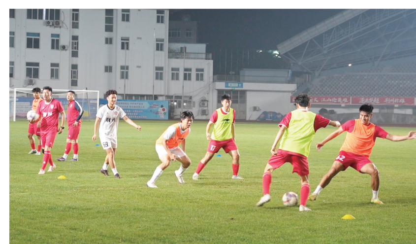
荆州恒隆队在荆州奥体中心进行高强度对抗训练。聚力、奋勇冲锋,在绿茵赛场展现永不言弃的拼搏风采,全力以赴打好客场比

目前,球队已完成全面的战术储备与体能备战,全体队员斗志昂扬、信心满满。怀揣着全市球迷的期许与厚爱,荆州恒隆队全体将士纷纷表示,将凝心