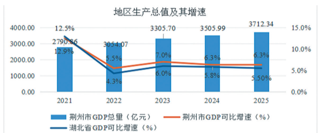
图1-1 2021—2025年地区生产总值增长变化情况

1. 规模能级跨上新台阶。地区生产总值连续突破2500亿元,3000亿元,3500亿元关口,稳居全省第4位。2021—2025年分别增长12.5%、5.5%、7.0%、6.3%、6.3%,2025年达到3712.34亿元,“十四五”期间年均增长7.5%,占全省比重由2020年的5.4%提升至5.92%。三次产业结构由2020年的18.9:33.7:47.4调整为17.9:35.2:46.9。地方一般公共预算收入达到190.99亿元。