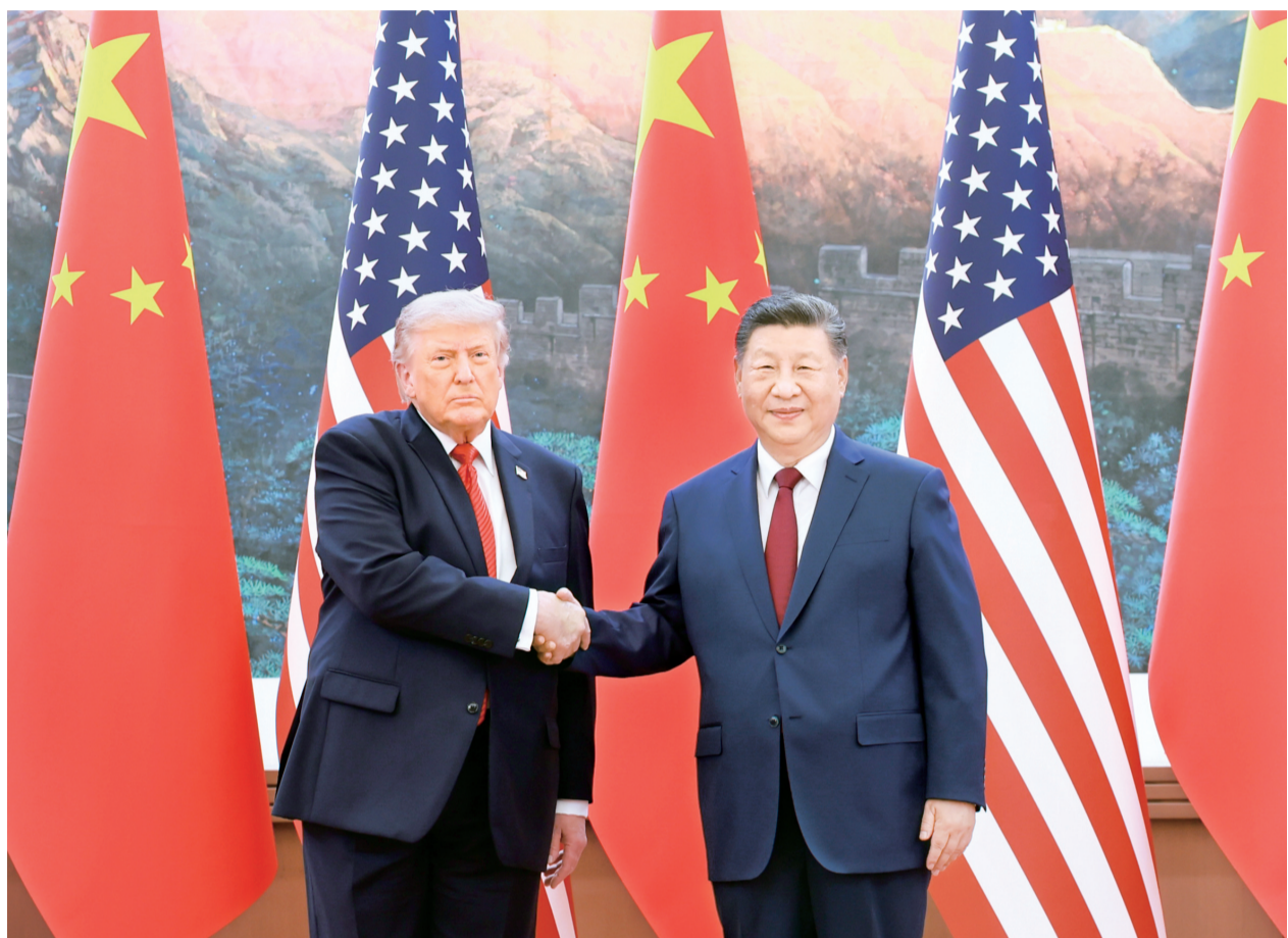
5月14日上午,国家主席习近平在北京人民大会堂同来华进行国事访问的美国总统特朗普举行会谈。