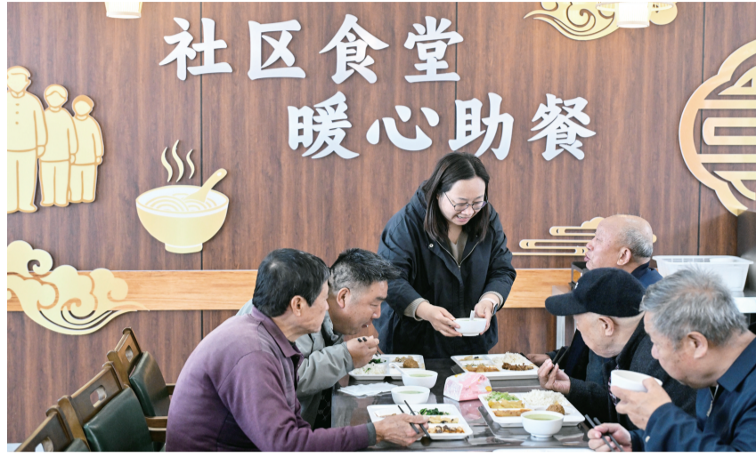
2026年4月29日,在江苏省扬州市江都区邵伯镇甘棠社区幸福邻里食堂,社区工作人员给老年居民端汤。

刘钢认为,包括检验检测认证行业在内的生产性服务业,还有很大扩容空间。服务覆盖面有待进一步拓展,既服务传统制造业转型升级,也推动新能源、数字经济、智能制造等新兴产业发