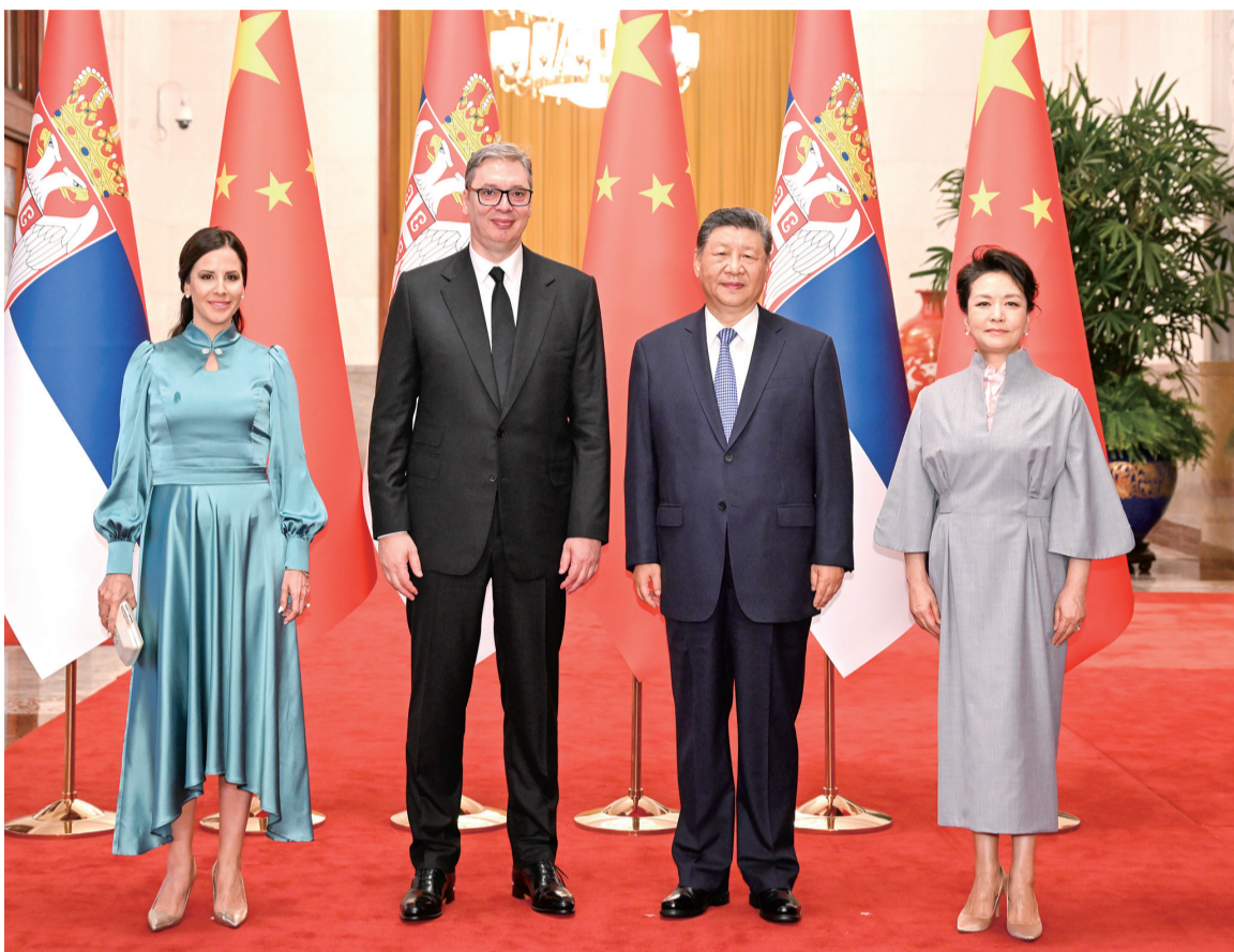
5月25日下午，国家主席习近平在北京人民大会堂同塞尔维亚总统武契奇举行会谈。这是会谈前，习近平和夫人彭丽媛同武契奇和夫人塔玛拉合影。