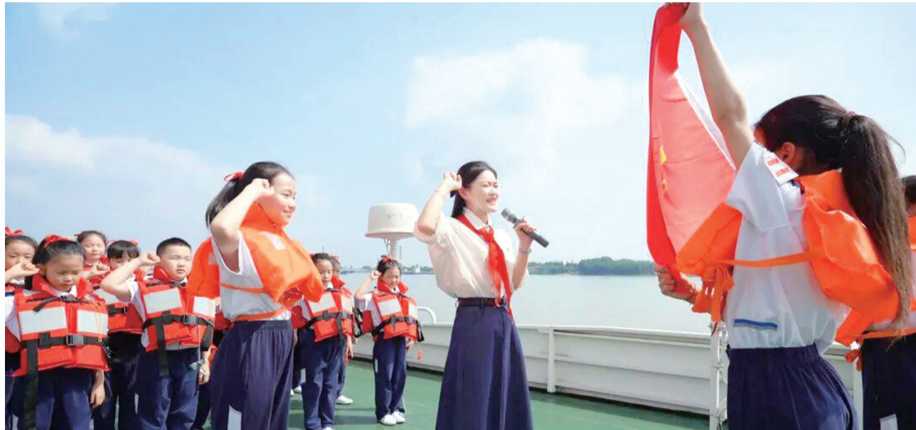
▲荆江小学举行少先队员新队员入队仪式,用仪式教育厚植队员荣誉感。

六月繁花似锦,童心向阳绽放。“六一”国际儿童节期间,沙市区以立德树人根本,深耕“五育并举”育人理念,统筹校园文化、社会实践、公益关爱等多维载体,推出一系列有温度、有内涵、有品质的节日活动。城乡校园里欢声笑语,处处暖意融融,广大少年儿童在多彩体验中收获快乐、涵养品格、汲取力量,全方位展现新时代沙市少年朝气蓬勃、向阳成长的精神风貌。