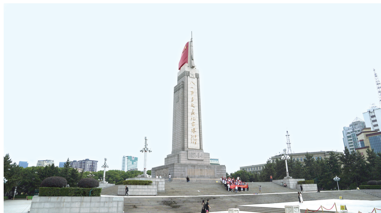
这是江西南昌八一广场上矗立的八一南昌起义纪念馆。

砰!砰!砰!——三声清脆的枪响打破夜晚的静谧。经过4个多小时激烈战斗,中国共产党领导的起义军占领了南昌城。