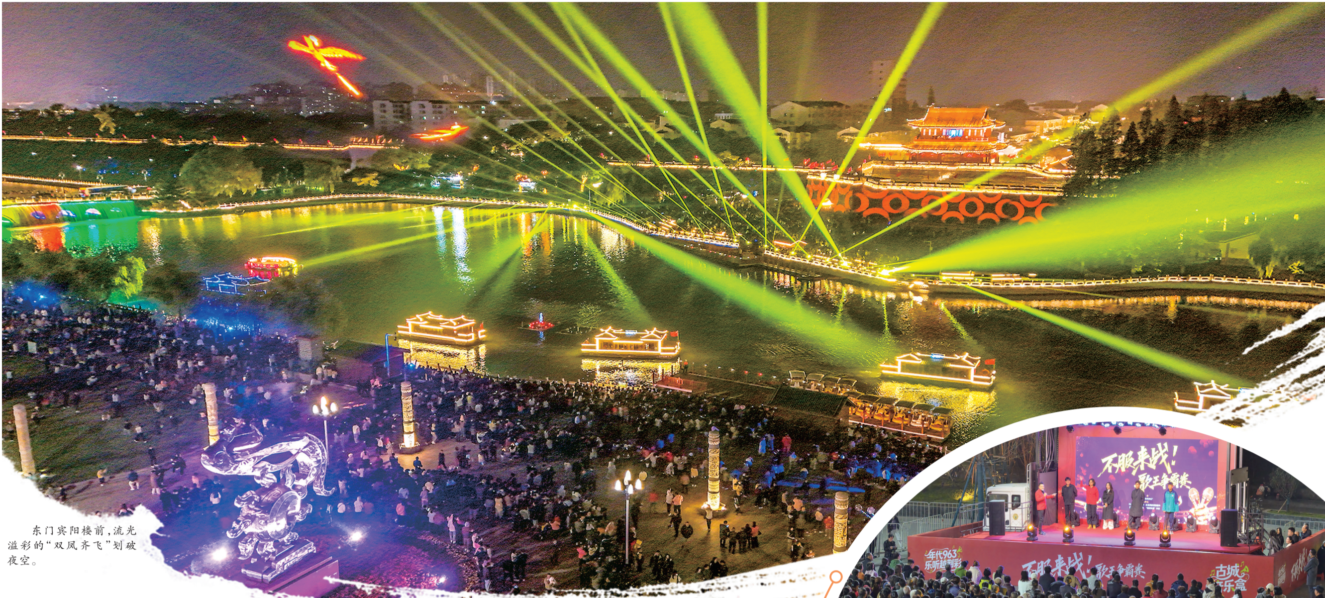
东门宾阳楼下,流光溢彩的“双凤齐飞”划破夜空。