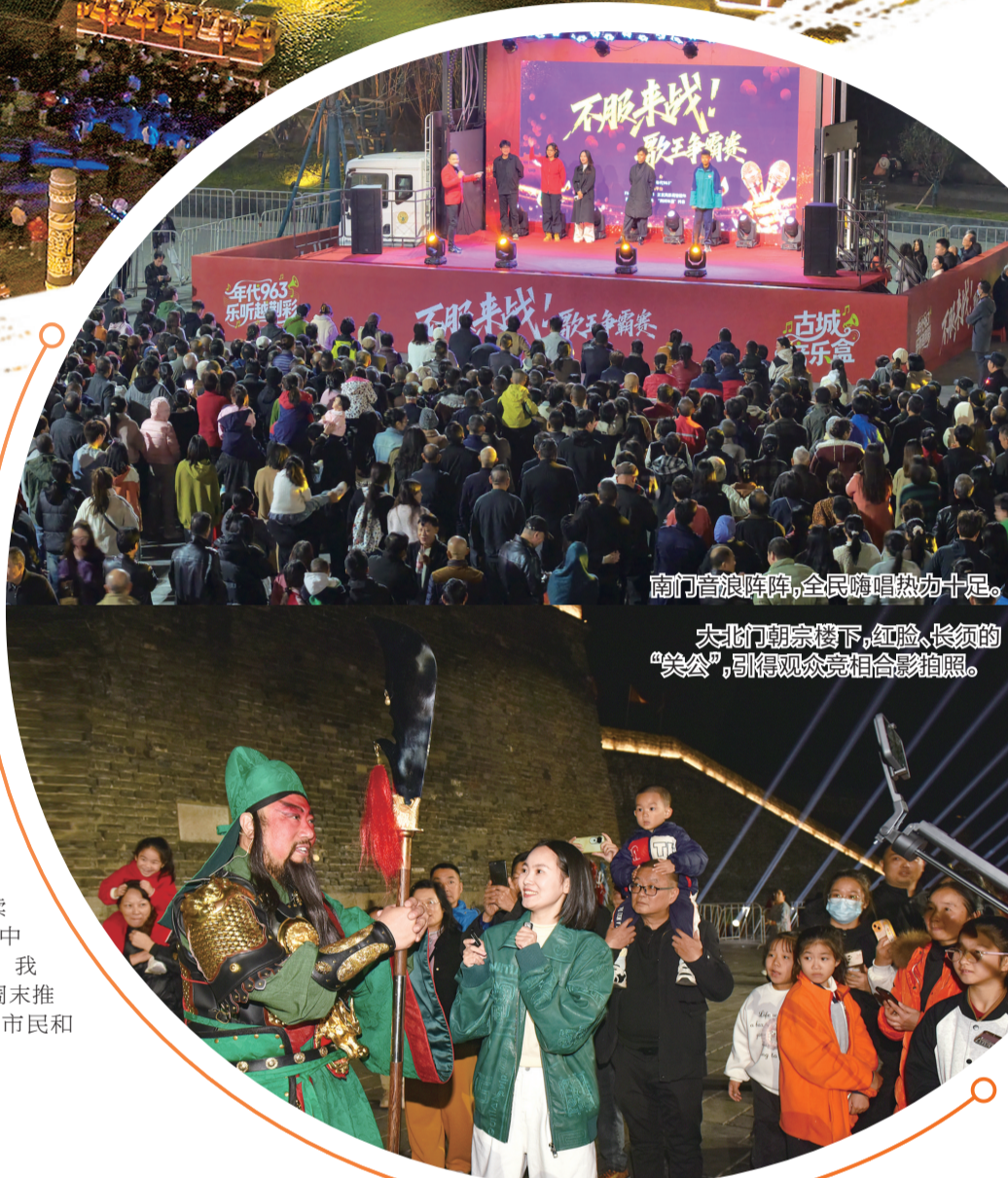
南门音浪阵阵,全民嗨唱热力十足。