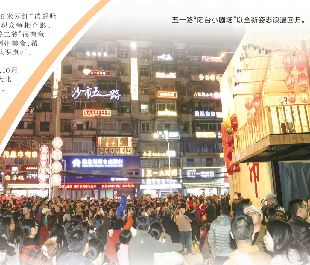
五一路“阳台小剧场”以全新姿态浪漫回归。