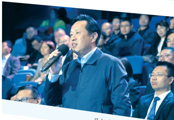
区相关部门负责人回答提问。