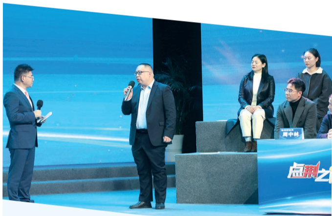
市民代表现场提问。