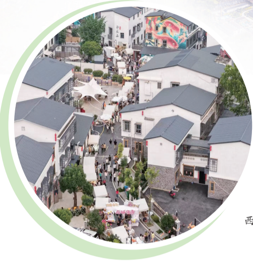
西瓜山新貌。