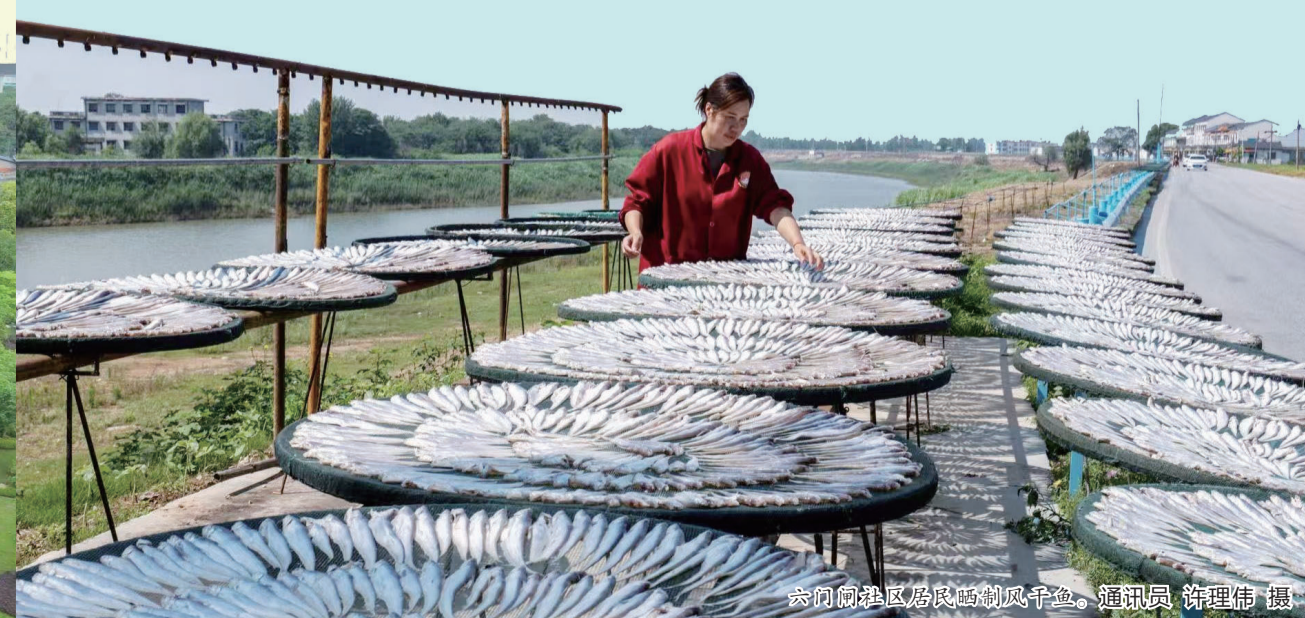
六门闸社区居民晒制风干鱼。