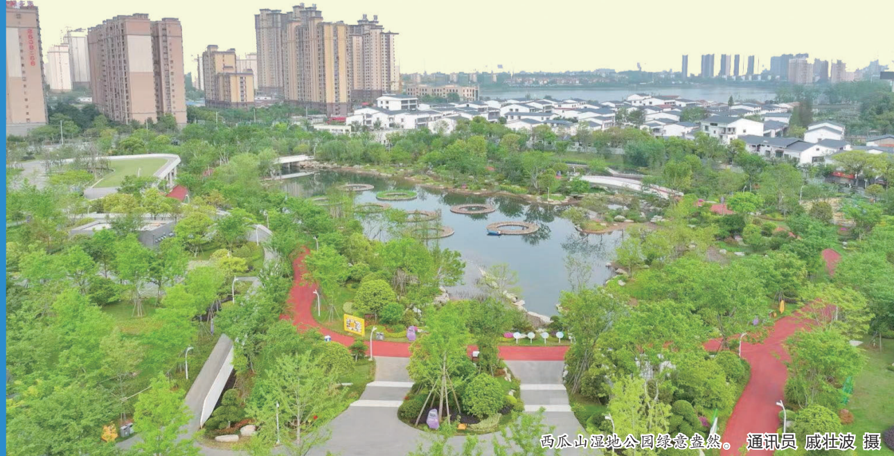
西瓜山湿地公园绿意盎然。