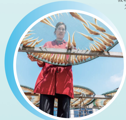
六门闸社区居民晒制风干鱼。