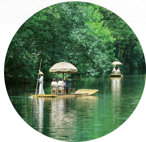
荡舟西溪南。