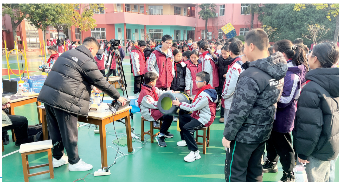
科技嘉年华进校园

近日,石首市科协联合市文昌小学开展“科技筑梦玩转科学”第十届科学探索嘉年华活动,让学生在动手实践中探索科学奥秘,在趣味竞技中感受科技魅力。