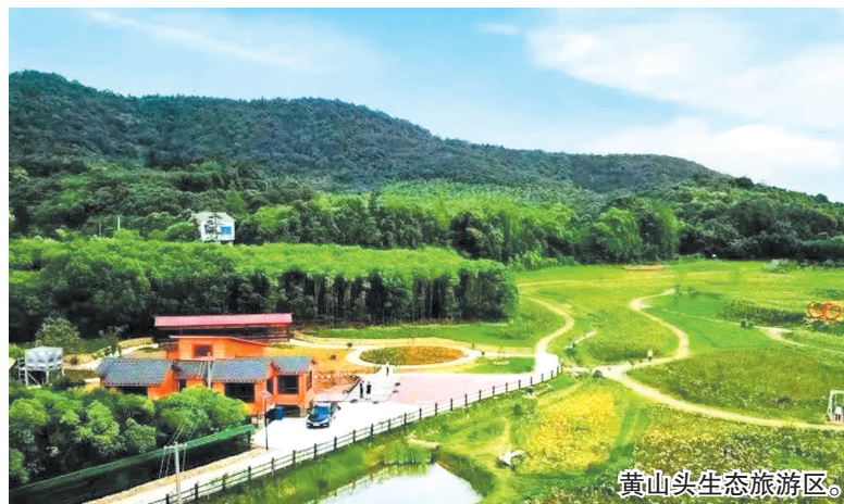
黄山头生态旅游区。

菩提树等珍稀树种;楠竹、松杉达2万余亩;还盛产骨风、对月草等近百种名贵中药。动物鸟类繁多,拥有爬行类动物31种,山涧两栖类两目7种,兽类7目13科37种,鸟类130余种。